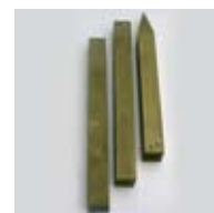
Paal Art. no.: WG901