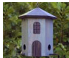
Tornmatare blauw Art. no.: WG244