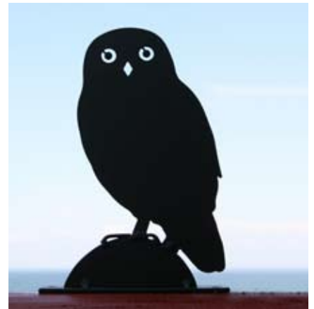
Steenuil Art. nr.: WG706

Nieuw in het assortiment van Wildlife Garden is een serie decoratieve en karakteristieke Silhouetten van veel voorkomende tuinbezoekers.