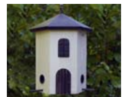
Tornmatare wit Art. no.: WG245