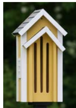
Vlinderkast geel Art. no.: WG304