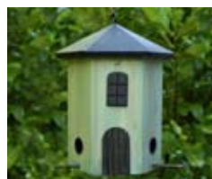
Tornmatare groen Art. no.: WG243