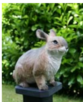
DecoAnimal Konijn Art. no.: WG471