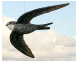
Gierzwaluw Art. no.: WG422