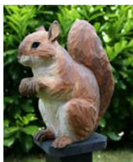
DecoAnimal Eekhoorn Art. no.: WG472