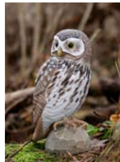
DecoBird Steenuil Art. no.: WG455