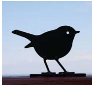
Roodborstje Art. nr.: WG702