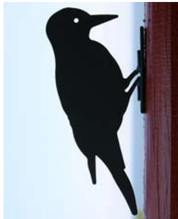
Bonte Specht Art. nr.: WG705