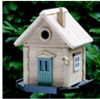
Skogsstugan Art. no.: WG210