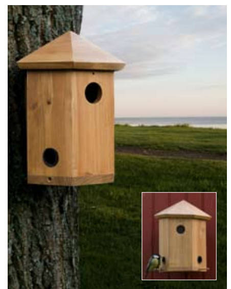
Tornholk Art. no.: WG227