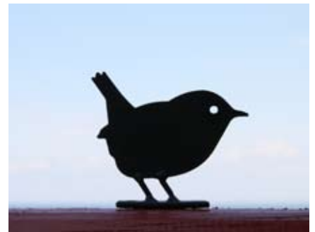
Winterkoning Art. nr.: WG703