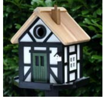
Tudor Art. no.: WG211