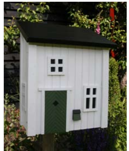
Mail Cottage Wit Art. nr.: WG309