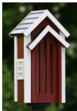
Vlinderkast rood Art. no.: WG301

Accessories: Een montageplaat voor montage op een paal is bijgesloten