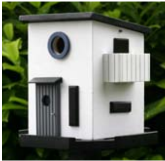
Funkis Art. no.: WG208