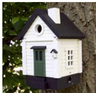
Wandmontage Vitt hus Art. no.: WG214