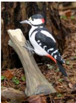
DecoBird Bonte specht Art. no.: WG451