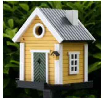
Villan Art. no.: WG204