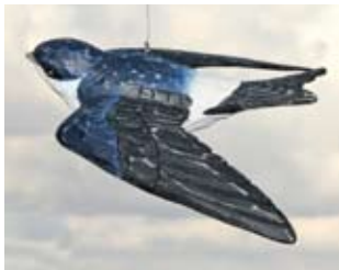
Huiszwaluw Art. no.: WG421