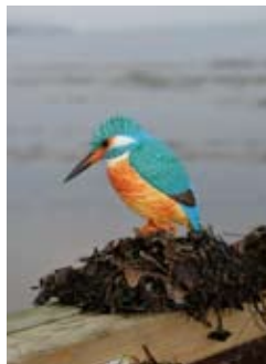
DecoBird Ijsvogel Art. no.: WG454