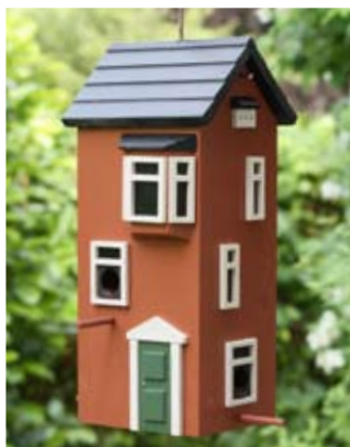
Terracotta Art. no.: WG231