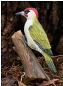
DecoBird Groene Specht Art. no.: WG452