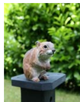
DecoAnimal Wolrat Art. no.: WG474

Een serie van ambachtelijk vormgegeven houten dieren bestaande uit levensecht vorm- en kleurgegeven modellen van de bekendste Europese tuinbezoekers. De dieren zijn op ware grootte gemodelleerd en beschilderd met milieuvriendelijke verf. De DecoAnimals zijn geschikt voor zowel binnen- als buitengebruik.