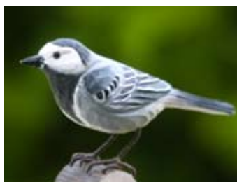
Witte kwikstaart, WG405