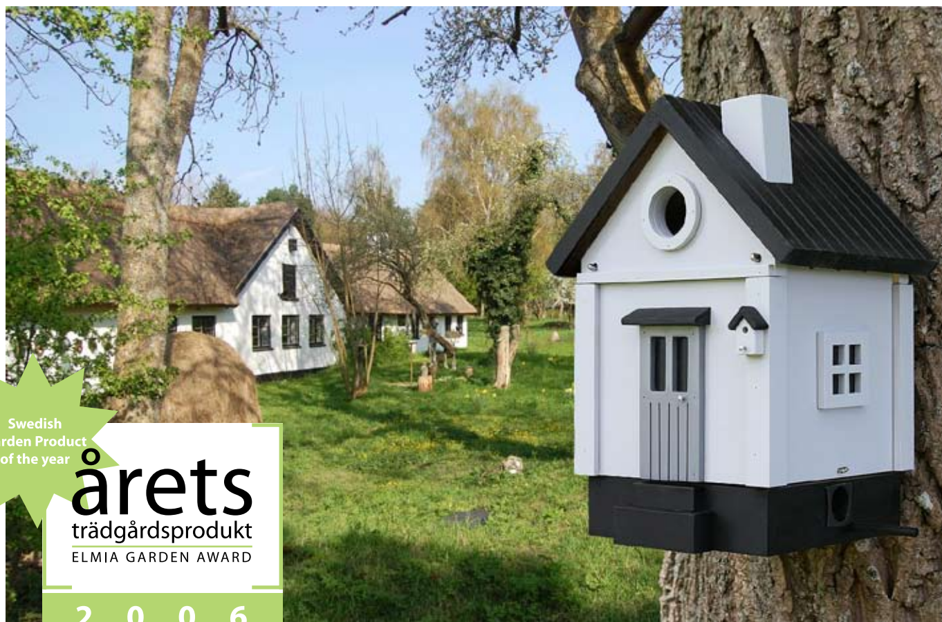
Graa Villan Art. no.: WG212