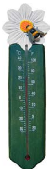
Thermometer Hommel Art. no.: WG562