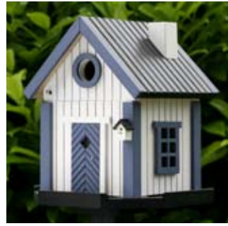
Sjöboden Art. no.: WG203