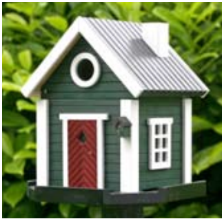
Stugan Art. no.: WG207