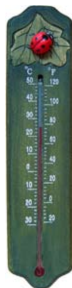
Thermometer Lieveheersbeestje Art. no.: WG564