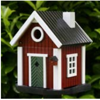
Torpet Art. no.: WG201