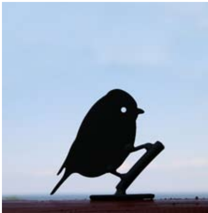
Pimpelmees Art. nr.: WG704