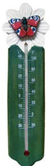
Thermometer Vlinder Art. no.: WG561

De thermometers van Wildlife garden zijn geschikt voor zowel binnen- als buitengebruik. De serie bestaat uit ambachtelijk vervaardigde kunstwerkjes en zijn een lust voor het oog!