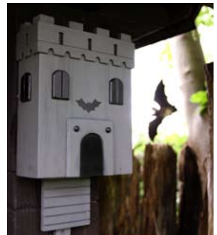
Fladdermusborgen Art. no.: WG306