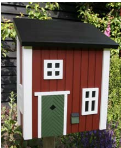
Mail Cottage Rood Art. nr.: WG307

Materiaal: Gemaakt van duurzaam hout uit goed beheerde bossen. Zowel het materiaal, de (milieuvriendelijke) verf als de lijm zijn blootgesteld aan uitvoerige duurzaamheidstesten. Gewicht: 2,3 kg Afmetingen: 320 x 210 x 390 mm Verpakking: Vriendelijke displayverpakking Overig: De Mail Cottage wordt ongemonteerd in 7 delen geleverd. Een duidelijke montage-instructie en montage-materiaal zijn bijgesloten