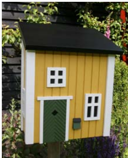
Mail Cottage Geel Art. nr.: WG308