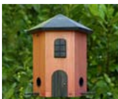
Tornmatare rood Art. no.: WG241