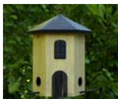
Tornmatare geel Art. no.: WG242