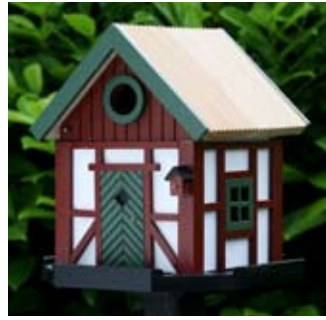
Skånelången Art. no.: WG202