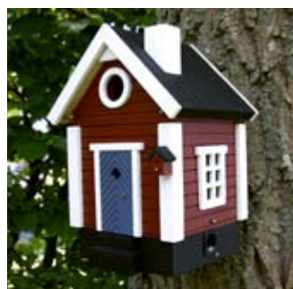
Wandmontage Torp Art. no.: WG213