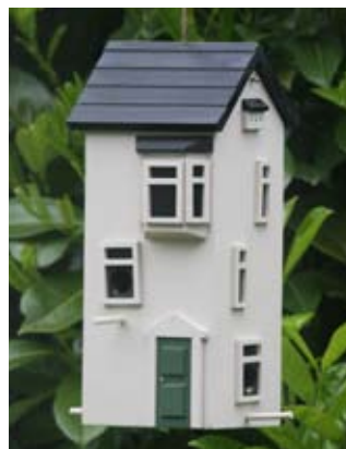
Sandstone Art. no.: WG232