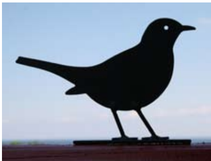
Merel Art. nr.: WG701