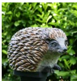
DecoAnimal Egel Art. no.: WG473