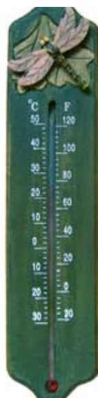
Thermometer Haft ééndagsvlieg Art. no.: WG563